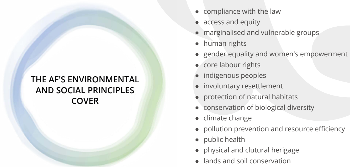
Figure 2 : Couverture des principes environnementaux et sociaux du FA

La politique décrit également (i) la nécessité pour les institutions de mise en œuvre de disposer d'un système de gestion environnementale et sociale conforme à la politique du FA et (ii) le processus de mise en œuvre de la politique environnementale et sociale (examen préalable, évaluation environnementale et sociale, plan de gestion environnementale et sociale, suivi, rapports et évaluation, divulgation et consultation du public et mécanisme de recours).